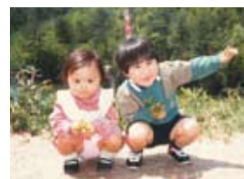
▲兄と2人で祖母の故郷・広島県福山市にて

2,513票をいただき、2期目の当選。区民委員会委員長、少子高齢化対策特別委員会に所属。現在は、民進党議員団幹事長、総務委員会委員、少子高齢化対策特別委員会委員を務める。民進党全国青年委員会副委員長、都連青年委員会幹事長。