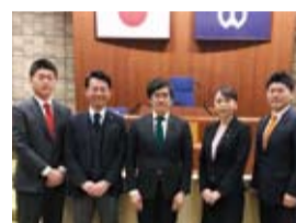
▲中野区議会民進党議員団