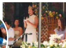
▲メイデーでのスピーチ