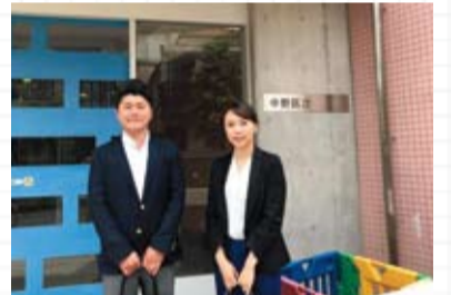
▲母子生活支援施設

◆4月29日、Big Up石巻×民進党青年委員会×連合三多摩の被災地支援ブースのお手伝いへ。東日本大震災から形を変えて支援を続けてきましたが、引き続き連携をできることを続けていきたいと思えます。