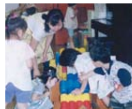
▲宝仙幼稚園でのボランティア活動