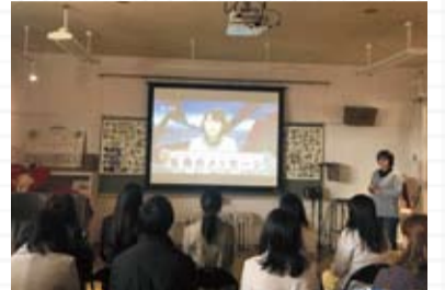
▲いのちのミュージアム

◆3月8日の「国際女性デー」は、「乳がん子宮頸がん検診促進議員連盟」設立2周年記念講演およびオープンディスカッションに参加をしました。改めて、国や都と連携をし、女性特有のがん対策に取り組んでいきます。