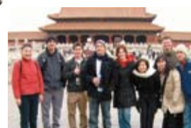
▲北京大学に短期留学