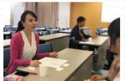
▲インターンマッチングフェア

◆5月16日、豊島区のまちづくりを学びに椎名町および池袋へ。商店街にある小さなお宿「シーナと一平」、長崎二丁目家庭科室、南池袋公園、豊島区役所、リノベで作られたカフェをまち歩きをしながら視察しました。