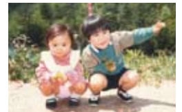
▲兄と2人で祖母の故郷・広島県福山市にて