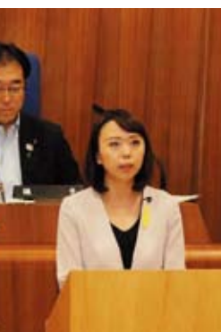
◀ R1年第2回定例会一般質問

A 行政に対するニーズが複雑・多様化するなど職員に求められる能力や資質のレベルが高まっている。人材育成ビジョンの改訂は基本構想・基本計画等の改訂作業と並行し内容の整合性を取りながら検討を行っていく。