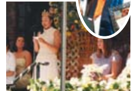
▲メイデイでのスピーチ