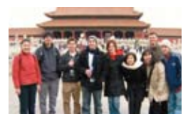
▲北京大学に短期留学