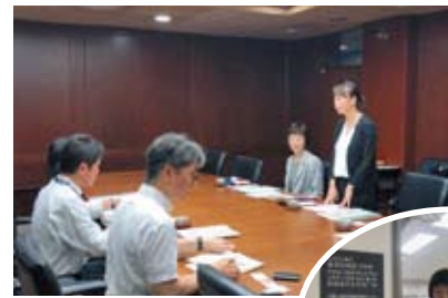
新宿区多文化共生視察▶

7月29日(月)新宿区の多文化共生施策の視察を行いました。近年のグローバル化や、4月に施行された改正入管法、来年に迫った2020オリンピックパラリンピックの影響もあり、東京に住む外国人人口は急増しています。中野区も例外ではありません。多文化共生はすぐにでも進めていかなければいけないと強く感じています。新宿区では長い間多文化共生を23区でも先進的に取り組まれており、多岐に渡る支援には中野区でも取り入れるべき視点がたくさんありました。