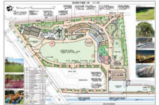
広町みらい公園完成予想図

方南通り沿い、島忠ホームズ向かいの旧国家公務員宿舎跡地がいよいよ「広町みらい公園」として9月23日にオープンします。オープンスペース、複合遊具や体験学習センターを併せ持つ特徴ある公園となる予定です。