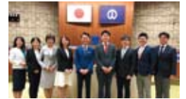
▲中野区議会立憲民主党無所属議員団

役職／前期は子ども文教委員会、中野駅周辺整備・都市観光調査特別委員会に所属。現在は総務委員会、危機管理・感染症対策調査特別委員会副委員長を務める。