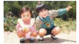
▲兄と2人で祖母の故郷・広島県福山市にて