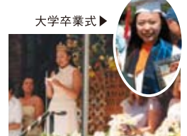
▲メイデイでのスピーチ