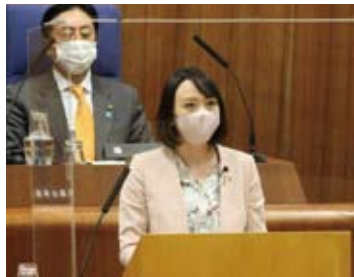
補正予算に賛成討論をしました

12月1日の総務委員会に「子育て世帯生活応援給付金事業について」報告がありました。18歳以下のお子さんを育てている家庭に所得制限なしで、子ども一人あたり2万円の給付となります。支給開始は2月頃になる見込みです。